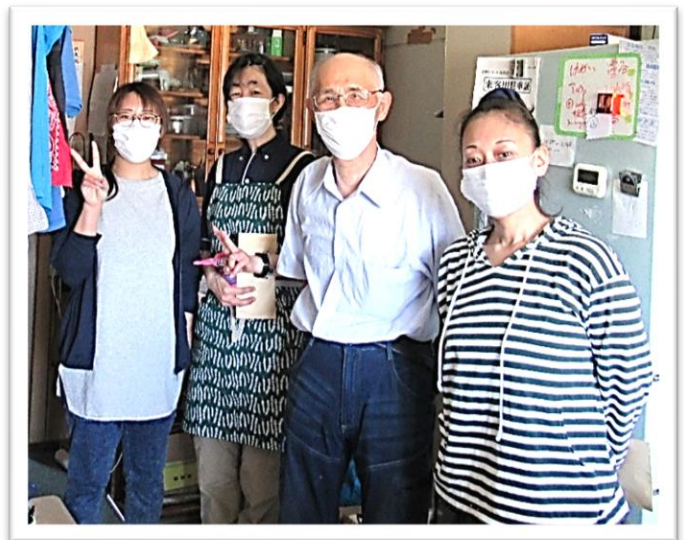
【活動後の集合写真v(^)v】