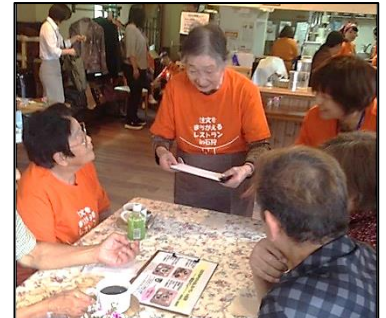
注文をまちがえるレストラン in 石狩