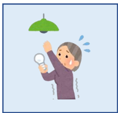
電球の交換が 難しい