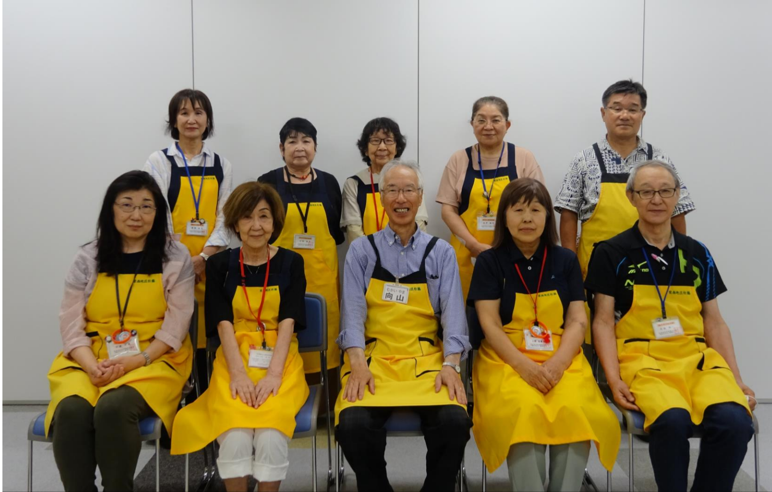
栄西地区福まち運営委員一同