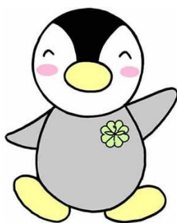
民生委員キャラクター ミンジー君

欠員補充を含めて、民生委員・児童委員の候補者をご推薦ください。 委員の年齢要件は、以下のとおりです。