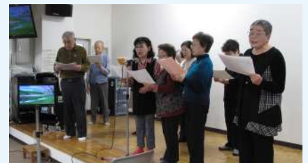
＜十三の会＞会場のステージ上で、合唱の練習をされていました。

また、それぞれの定例会の冒頭でお時間を頂き、「北区身近な生活支援ボランティア活動事例集」を用いて、北区内で活動されているボランティアグループの紹介をさせて頂きました。