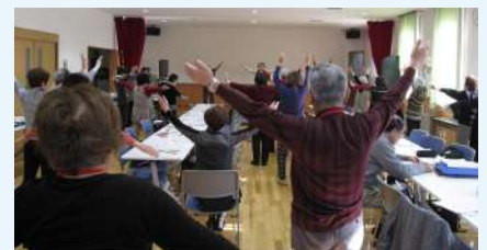
＜寿老会＞健康維持のため、毎回ラジオ体操を取り入れているそうです。

参加者の中には「事例集に載っている方のように、もし自分が外出することができなくなってしまって、囲碁を誰とも打てなくなると考えると寂しい。その時、ボランティアの方に来てもらって囲碁の相手をしてくれたら、きっと嬉しいと思う。