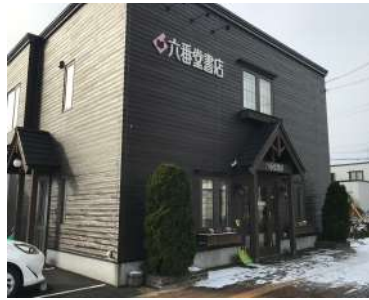
札幌市の有形文化財「新琴似屯田兵中隊本部」をモチーフにした店の外観。