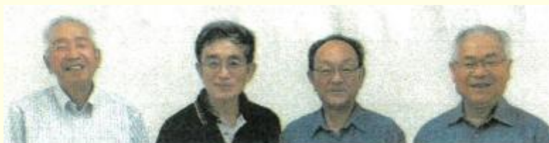
▲ 笑顔が素敵で、頼もしい4名のメンバー

日常生活で「ちょっと困った」時、相談できる先を知っていると安心ですね。この通信をご覧になってのご相談・ご依頼は、下記の 北区社会福祉協議会 でも承ります。