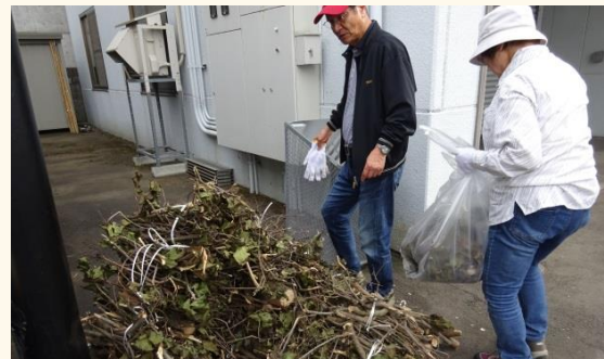
敷地内に積もった枝葉の処分