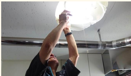
手が届きにくいところの電球交換