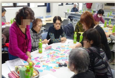
(北郷親栄第3町内会地域福祉交流会)

10月10日、北郷東町内会福祉推進会議（北郷東会館）、同19日、北郷親栄第3町内会地域福祉交流会で、生活応援ボランティア講座を開催しました。北白石地区では、高齢者福祉計画のもと、来年度に有償ボランティアグループ立ち上げが計画されています。2会場の研修会では、有償ボランティアにつながる助け合いの必要性について、お話をいただきました。