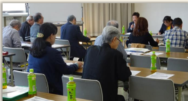
(北郷東町内会福祉推進会議)

10月10日、北郷東町内会福祉推進会議（北郷東会館）、同19日、北郷親栄第3町内会地域福祉交流会で、生活応援ボランティア講座を開催しました。北白石地区では、高齢者福祉計画のもと、来年度に有償ボランティアグループ立ち上げが計画されています。2会場の研修会では、有償ボランティアにつながる助け合いの必要性について、お話をいただきました。