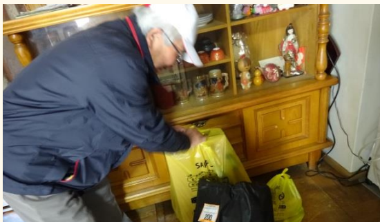
重たい大型ゴミ・燃えないゴミの処分

白石区では、平成29年に、在宅高齢者を対象とした日常生活のちょっとした困りごとを解決するボランティアグループとして、しろいし生活応援「ひだまり」が立ち上がりました。「ひだまり」では、本会に相談がくる内容のうち生活支援に関わる活動の支援を行っています。区内では、まだこのグループしか立ち上がっておりませんが、当事業では、地域の実情にあわせ、様々な形で支援できるグループの立ち上げを目指しております。