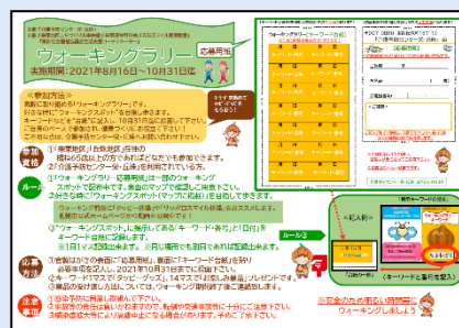
応募用紙イメージ図