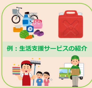
例：生活支援サービスの紹介

地域みなさんと一緒に栄西地区の よいところ をたくさん発見して情報共有をしていきたいと思っております。紹介して下さる情報等をご存じの方は、是非コーディネーターまでお知らせください！！