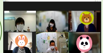
ZOOM を使用した交流の様子