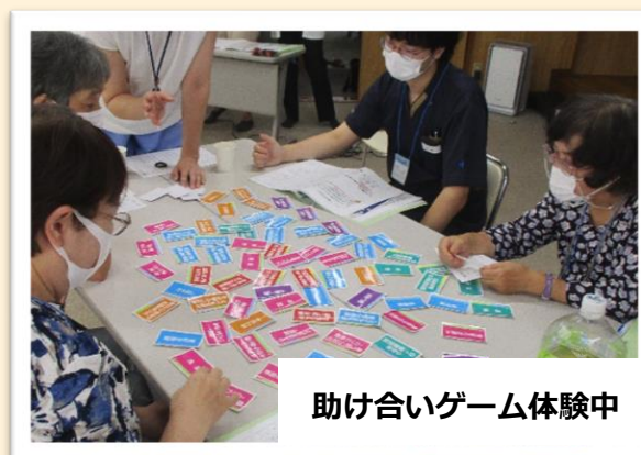
助け合いゲーム体験中

東区くらしのサポーター養成講座は、今年で3年目になり、受講者の「自分たちができること・得意なことを活かして何かやってみたい！」という思いから、新たな取り組みにつながった地区もあります。ある団地では、支え合いの仕組みづくりに向けて、サポーターの皆さんが「自分にできることなら」と、意見を出し合って取り組みを進めています。