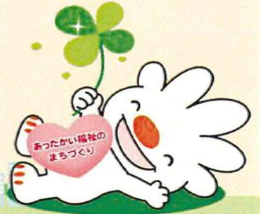
手稲区福祉のまちづくりキャラクター『ていね』