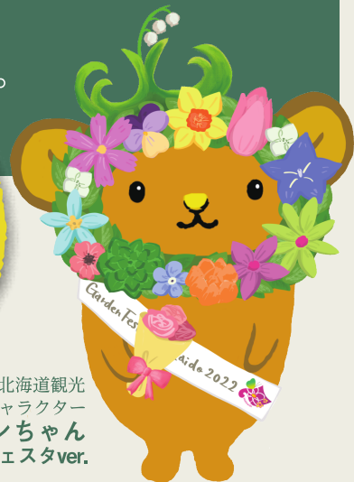
北海道観光 PRキャラクター キュンちゃん ガーデンフェスタver.