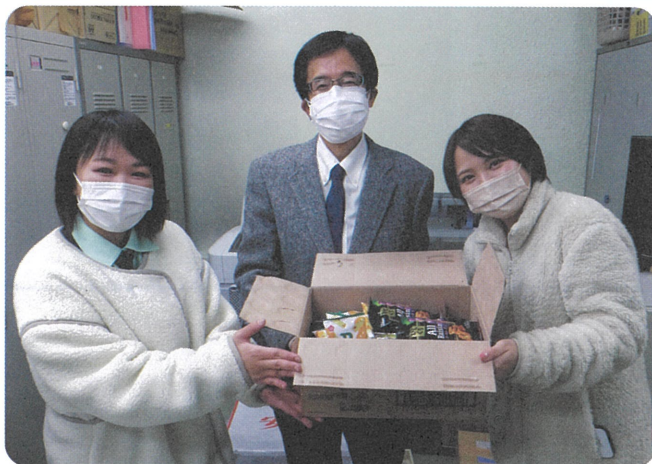
マルハン 琴似店様