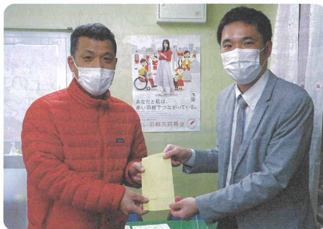
イトーヨーカドー 労働組合 琴似支部様