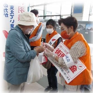
赤い羽根共同募金運動 街頭募金活動 10月1日～7日