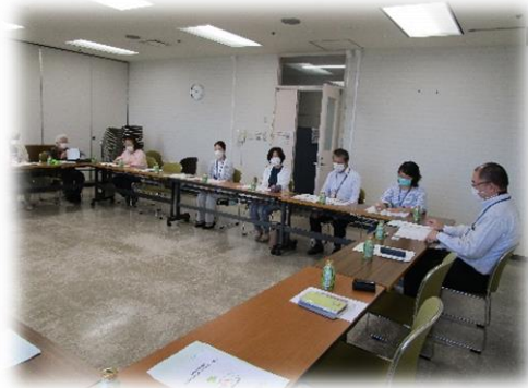
生活応援ボランティアのつどい 5/23・7/22・9/27・11/29