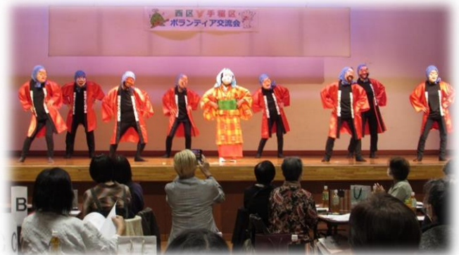
西区・手稲区ボランティア交流会 10月27日