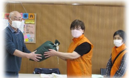
市私立保育園連盟手稲区会様へ 雑巾寄贈活動 4月26日

手稲区ボランティア連絡会は平成6（1994）年に設立しました。会員相互の交流を通じてボランティア活動の充実を図っています。手稲区のボランティア活動を、一緒に盛り上げていきましょう！