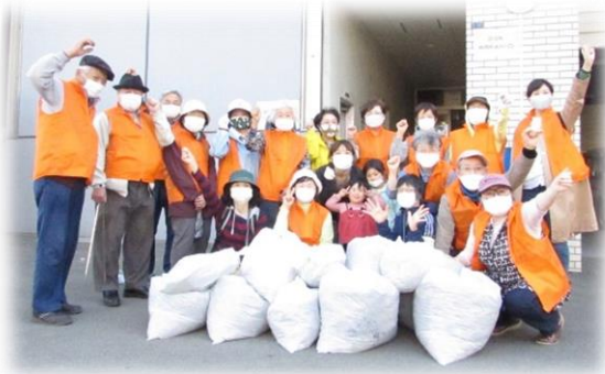
春の清掃活動 5月9日

ボランティア連絡会は、講演会・バス研修会・ボランティア交流会などを通じて、会員相互交流や情報交流を図り、地域福祉の向上を目指しています。