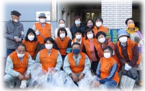
秋の清掃活動 10月11日