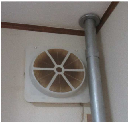
【換気扇フィルター交換前】