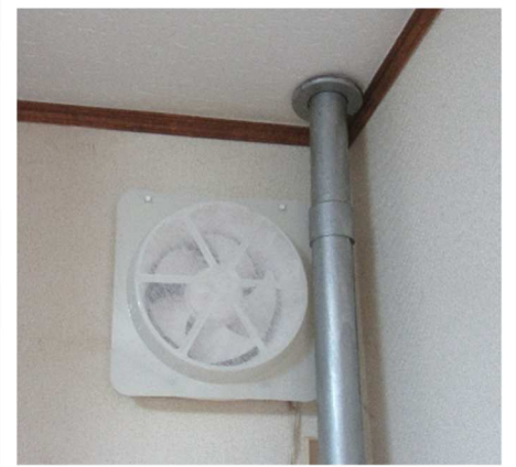
【換気扇フィルター交換後】