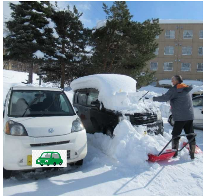
【除雪ボランティアの様子】