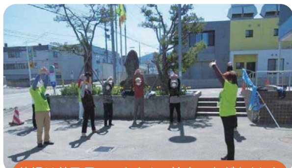
体操は普及員のみなさんに協力いただきました

西野地区福祉のまち推進センターと西野地区民生委員児童委員協議会では、様々な機会を捉えて住民の皆さんと関わり、関係機関と協力しながら「安心して暮らすことのできる地域づくり」を進めてまいります。