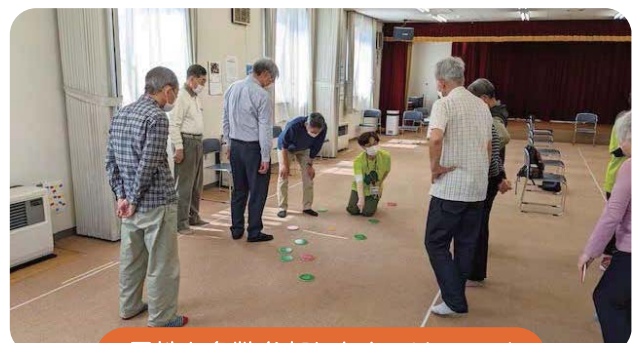
男性も多数参加したカーリンコン!