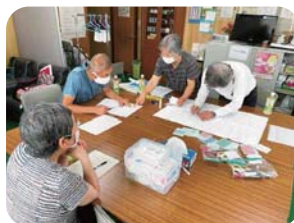
福祉マップの作成