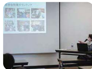
ボランティア入門研修