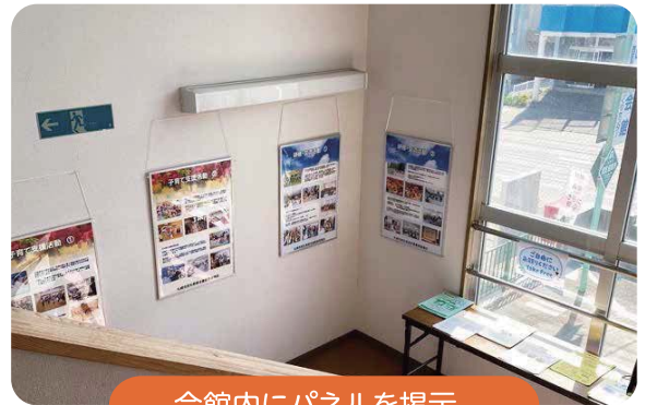
会館内にパネルを掲示

期間中はパネル展の開催のほか、民生委員・児童委員も参加した「おしゃべりコーナー」の開設のほかに、今年で10年目を迎えた「エコロコ!やまべエ体操」の普及のための体操教室、カーリングに似た「カーリンコン体験」も実施されました。