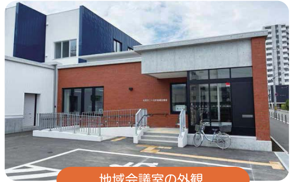
地域会議室の外観