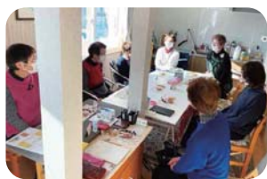
サロン活動の様子