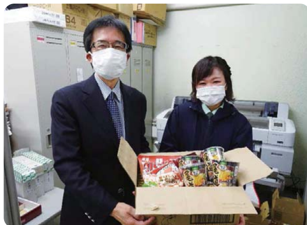
マルハン琴似店様