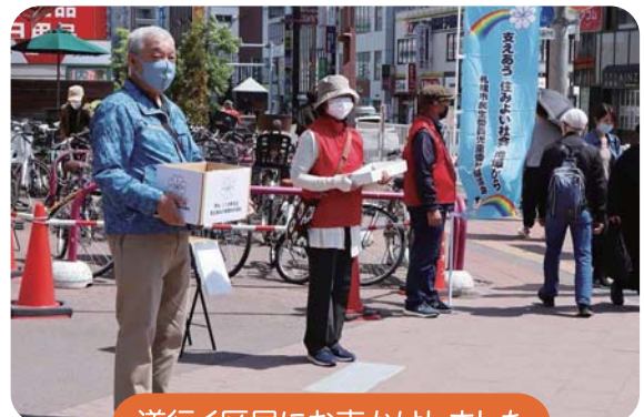
道行く区民にお声かけしました