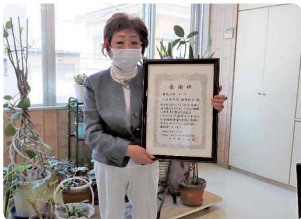
株式会社オーク様

令和4年 3月 匿名様 ..... 50,000円 4月 株式会社オーク様 ..... 300,000円 <物品寄附> 毎月 マルハン琴似店様 ..... お菓子の寄贈