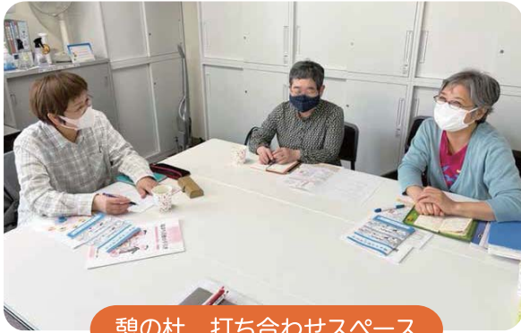
憩の杜 打ち合わせスペース

移転先のリニューアルした「憩の杜」においても、住民の見守り活動を進めるための福祉マップ作りなど、地域の福祉活動はこれまでと変わらず行われています。