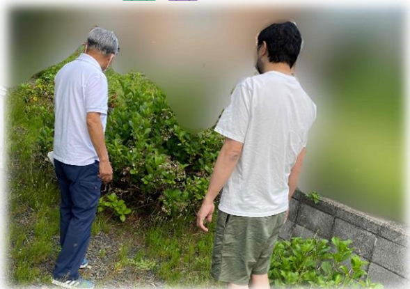
顔合わせの訪問時…草がたくさん！！