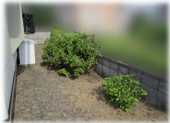
作業後…すっきりしました！